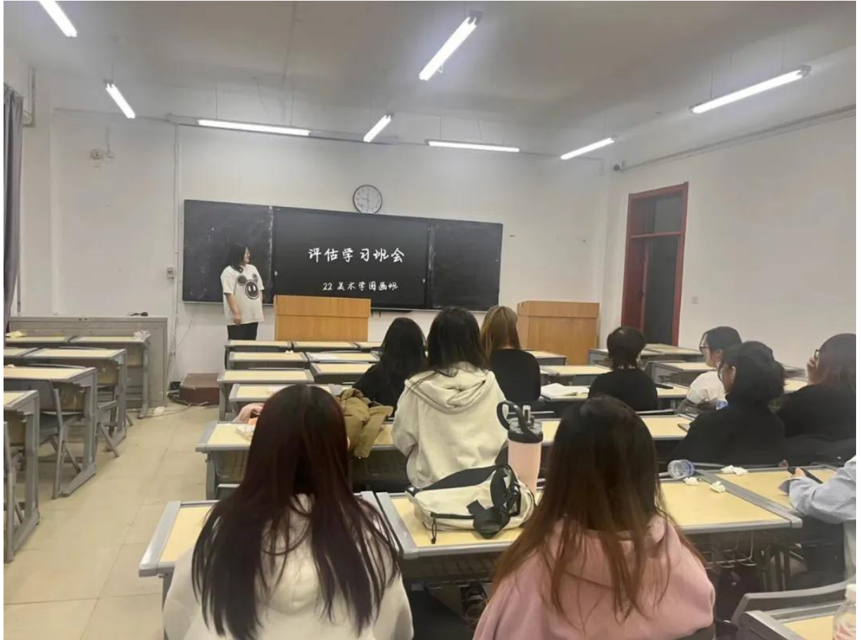
22 级美术学国画班本科审核评估学习