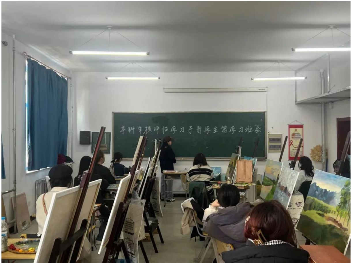
22 级美术学油画 1 班本科审核评估学习