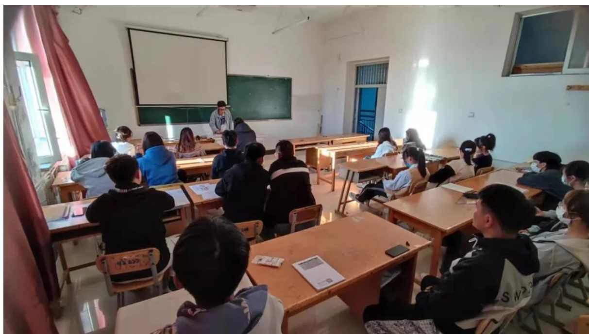
21级环境设计3班本科审核评估学习